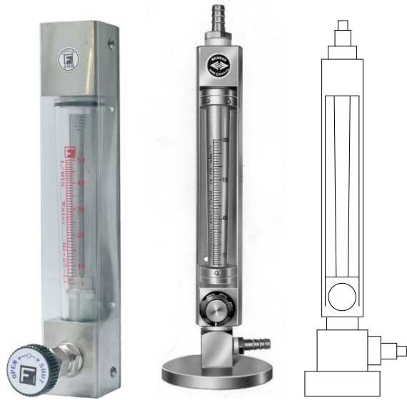
材質表 TYPE M標準型 護罩為壓克力